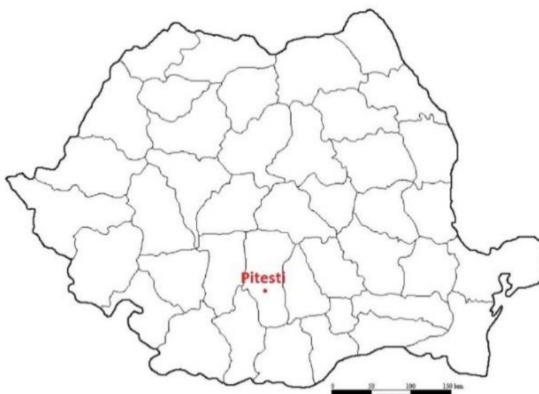
Mapa 6. Ubicación de Pitesti