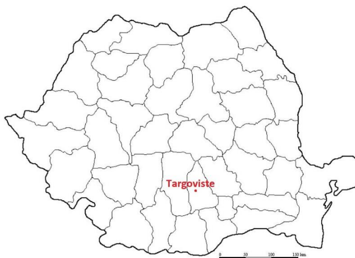
Mapa 9. Ubicación de Targoviste