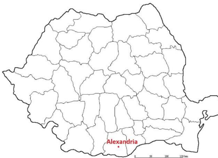
Mapa 3. Ubicación de Alexandria