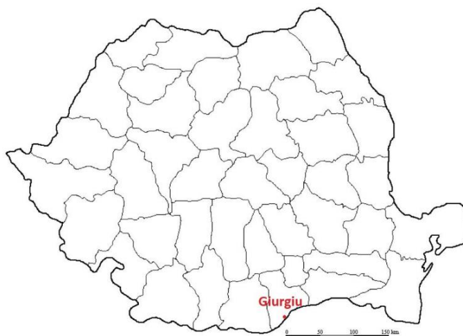
Mapa 5. Ubicación de Giurgiu