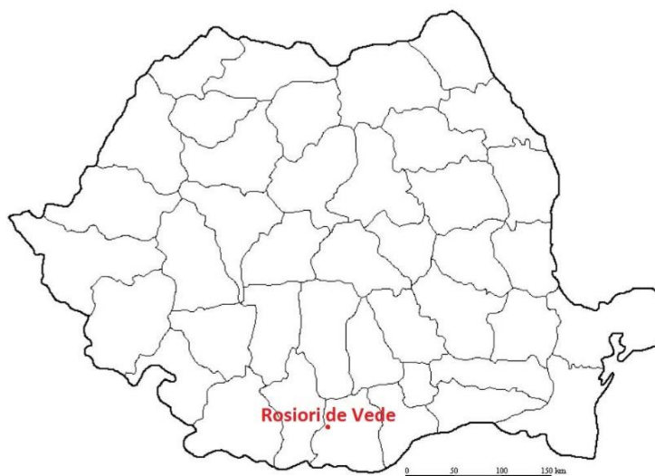
Mapa 8. Ubicación de Rosiori de Vede