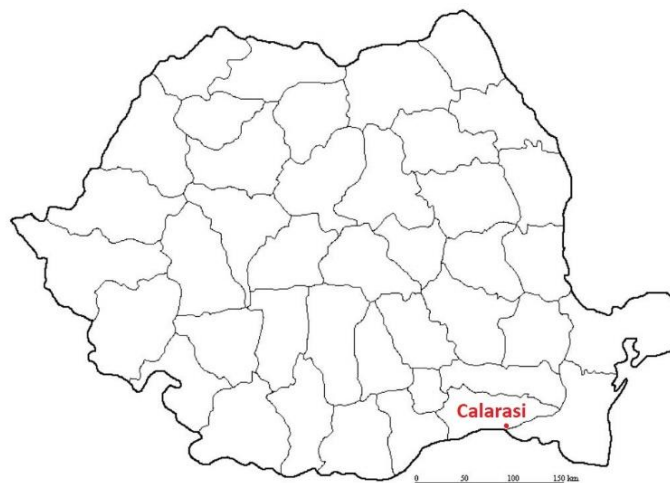
Mapa 4. Ubicación de Calarasi