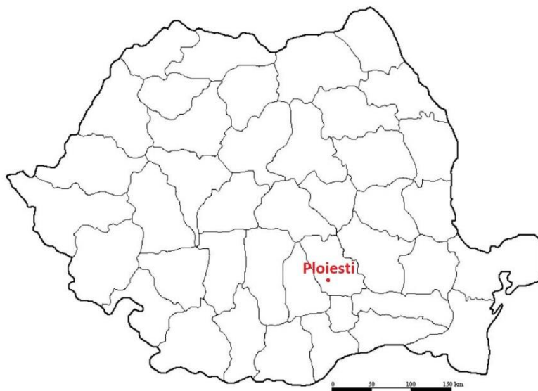
Mapa 7. Ubicación de Ploiesti