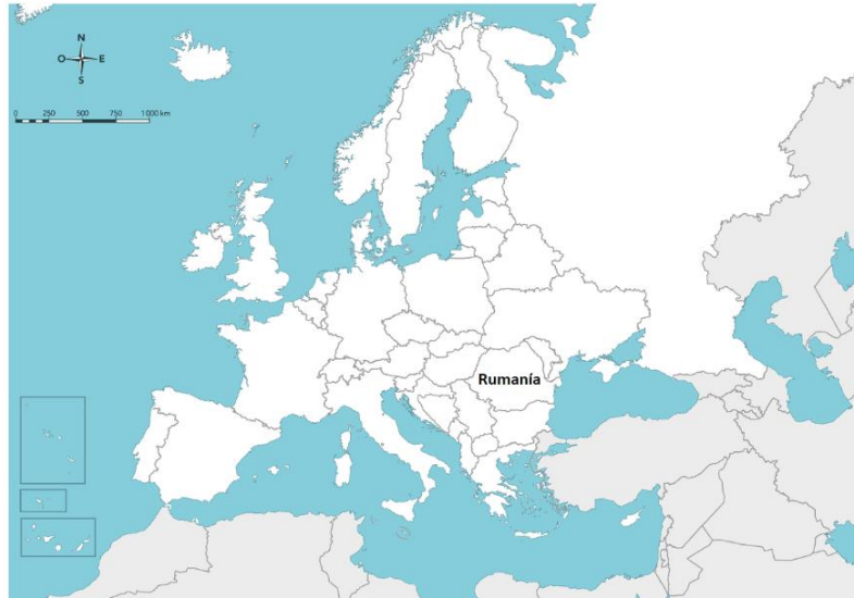
Mapa 1. Rumanía en Europa